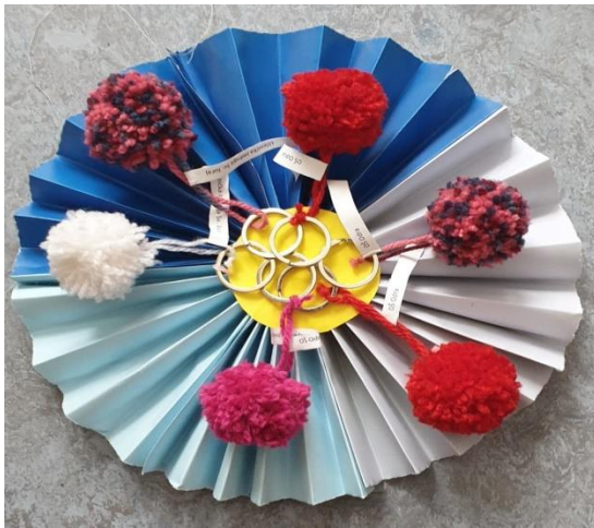
Učenci šestih razreda na radionici izrade cofleka