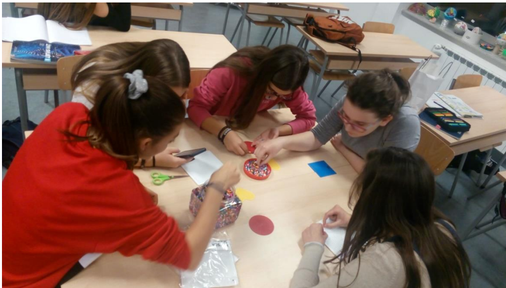
Učenici sedmih i osmih razreda na radionici izrade ukrasnih predmeta od Pyssla perlica