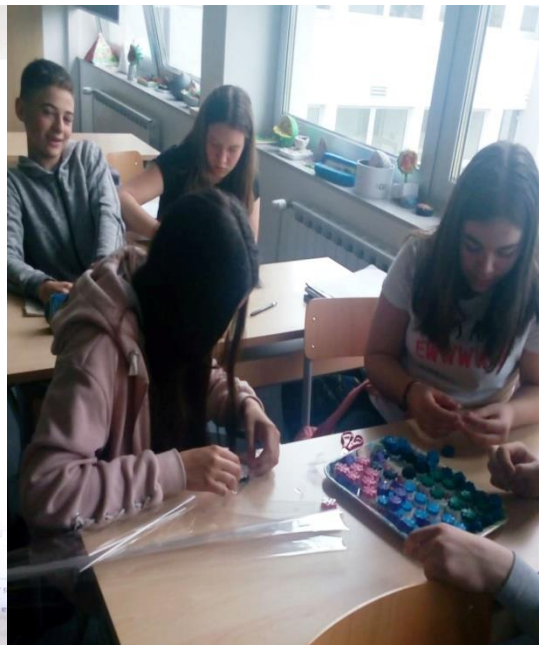
Učenci sedmih razreda prilikom radionice izrade sapuna