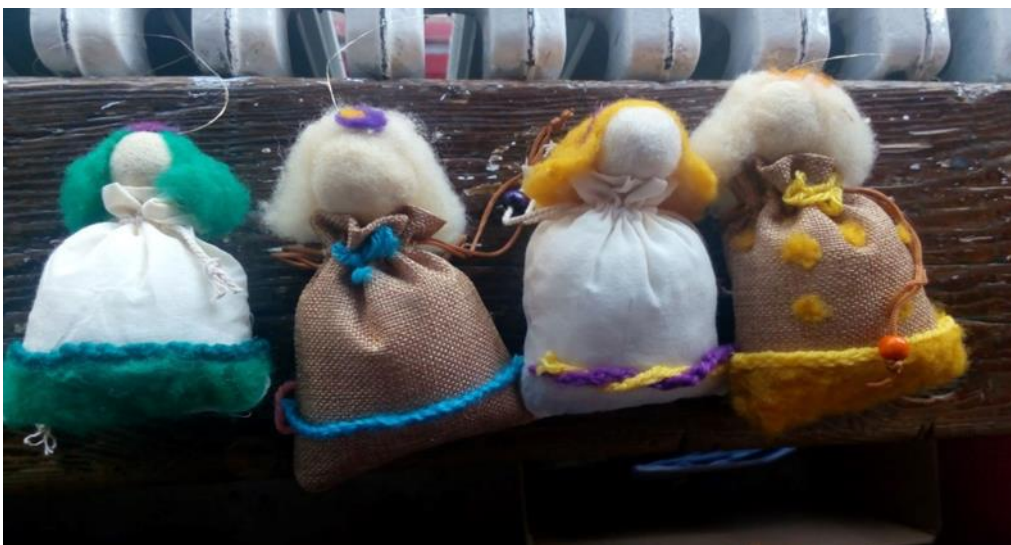
Radionica izrade lutkica od sirove vune