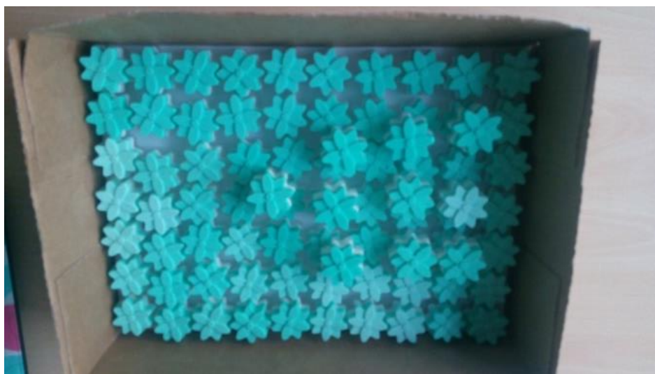
Ukrasni sapuni izrađeni u tri sloja, prozirni, bijeli i zeleni