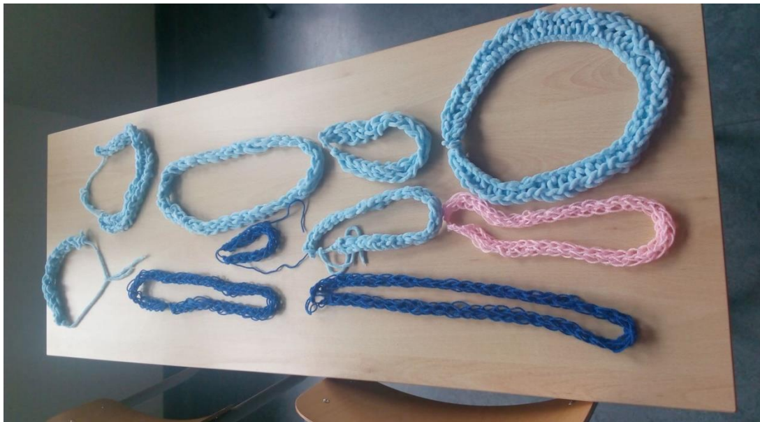
Učenici šestih razreda na radionici izrade nakita od vune