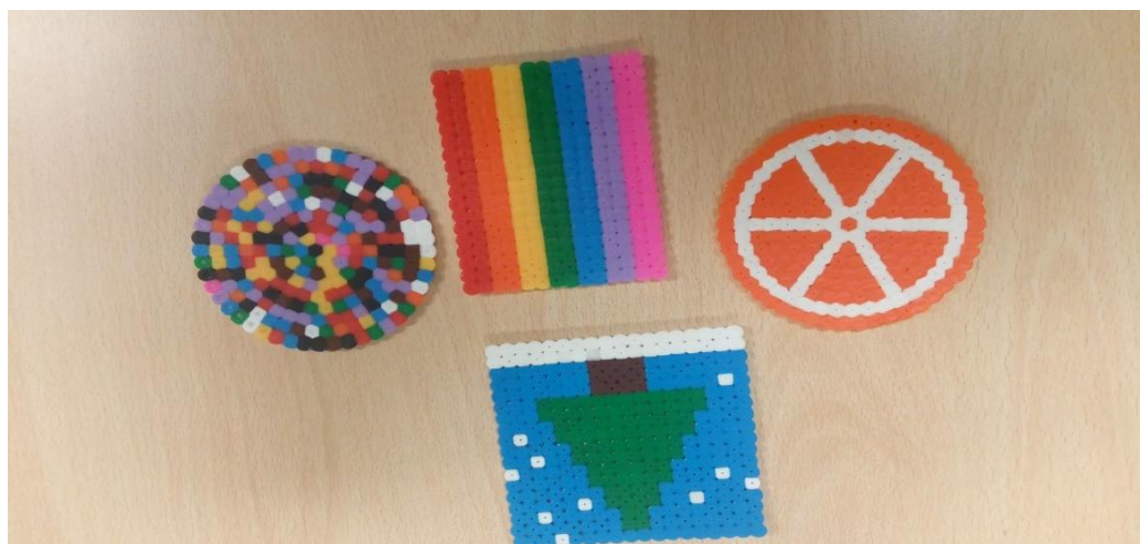
Pyssla podmetači i ukrasni predmeti