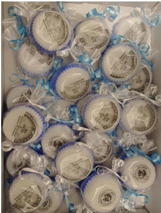
Pokloni za goste iz Rumunjske i Bugarske kao dio KA2 projekta: Becoming citizens.