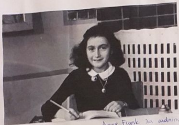
Anne Frank za radnim stolom

Dnevnik je pisan od 12. lipnja 1942. do 1. kolovoza 1944. godine. Anna je dnevnik počela pisati sama za sebe, a kasnije je čula, na radskoj postaji, da će se nakon rata objaviti sva svjedočanstva o patnjama Židova tokom rata, odlučila je da će objaviti knjigu koja će se temeljiti na njezinih bilješkama.