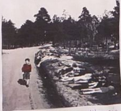
masovna ubijanja Židova